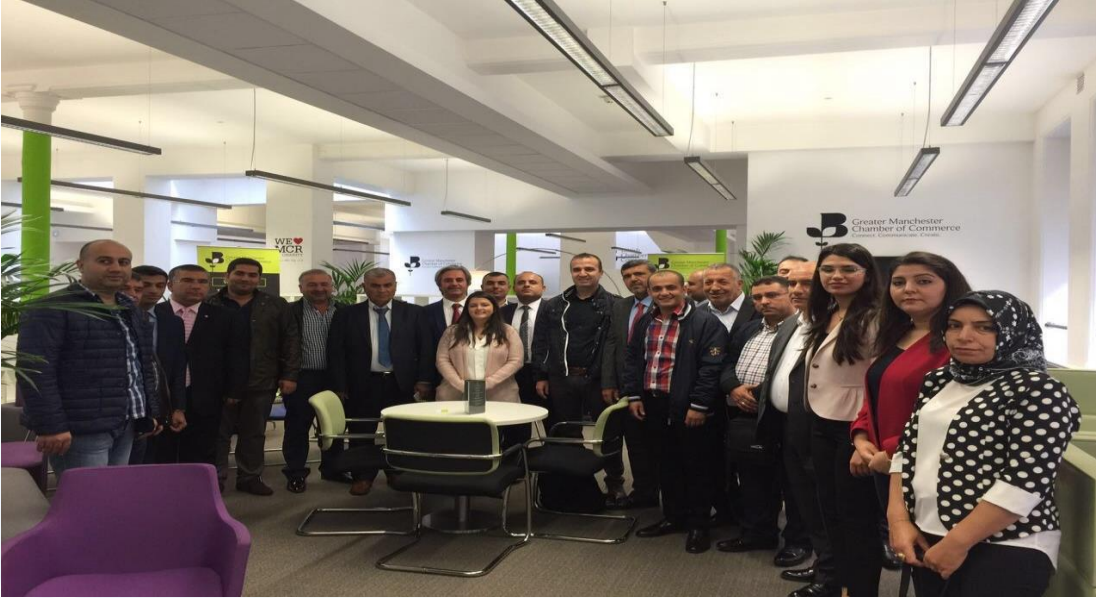
Londra ve Manchester Company Mission ve İkili Görüşmeleri