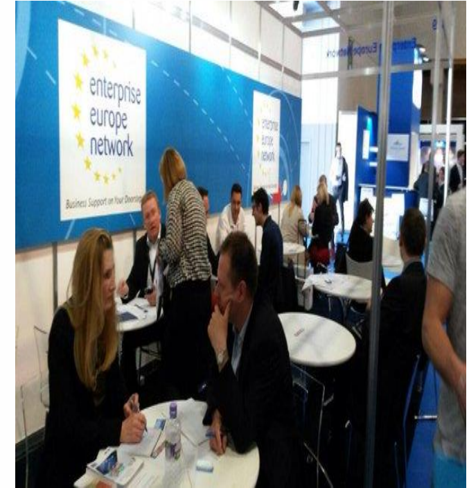
Bologna COSMOPROF Fuar Ziyareti ve İkili Görüşmeleri