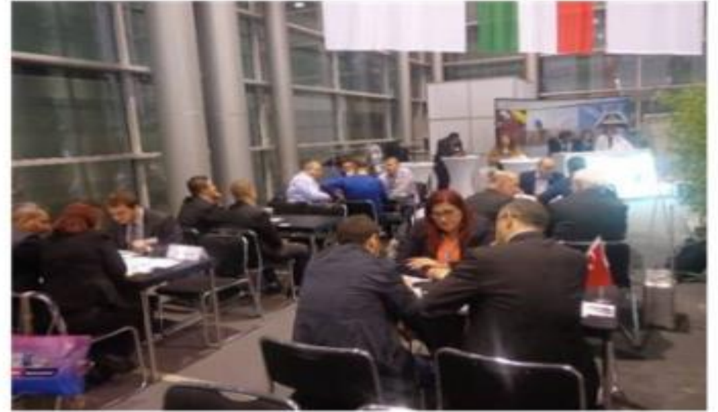
Duesseldorf K Plastik Fuarı Ziyareti ve İkili Görüşmeleri